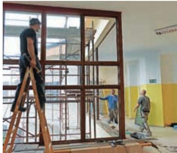
... in nova okna.

V toplo, prijetno odejo naj bodo v teh decembrskih dneh odeta tudi naša srca, naši medsebojni odnosi. V prazničnih dneh »naj svetijo