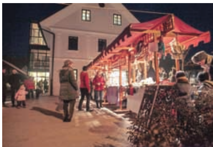
Nekaj prazničnega vzdušja je na Miklavžev dan prinesel tudi Miklavžev sejem.