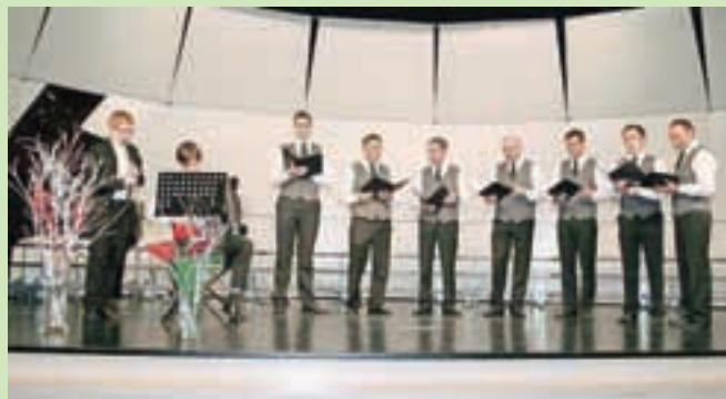
Šenturški oktet (z osmim članom za harmoniko) na jubilejnim, desetem koncertu.

Na leto oktet naniza nekaj deset nastopov z že tradicionalnim decembrskim koncertom. Najraje prepevajo slovenske narodne in umetne pesmi. Veliko pojejo na različnih obletnicah, kjer program popestrijo še s klasično harmoniko, v sestavu je tudi par odličnih solistov, ki dodatno obogatijo njihove nastope. Glede na to, da v oktetu pojejo pevci »dveh in pol« generacij, se med seboj odlično razumejo. »Mladost in starost gresta lepo skupaj, če se člani med seboj prilaga-