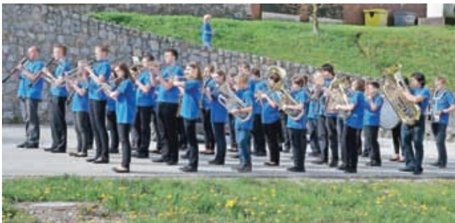
Cerkljanska godba je letos prvič igrala prvomajsko budnico.

Godba vsako leto septembra igra ob občinskem prazniku, igrajo na različnih pomembnih dogodkih v občini, vsako leto pa pripravijo tudi letni in božični koncert. Letos so prvič poskusili tudi s prvomajsko budnico in jo igrali po vaseh po skoraj celi občini. »Godbeniki so bili navdušeni, komaj čakajo na novo prihodnjega maja. Če smo se do lani naučili koračnic, nas zdaj čaka korakanje, ki je redka in precej zahtevna veščina,« je z napredkom godbe zadovoljen Kukovič: »Godba