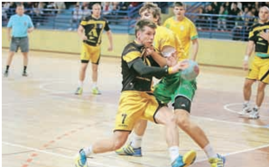
Članska ekipa Damahausa Cerklje je leto zaključila na četrtem mestu 1. B lige.