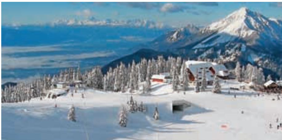
Smučišče Krvavec na svoje strmine vabi že vse od konca novembra.

Zavod za turizem Cerklje je nosilec projekta Aktivna regija Krvavec, ki združuje območje od Bleda do Ljubljane, preko Kranja, Preddvora, Kamnika, Domžal in seveda Cerklj. Skupna prizadevanja že dajejo rezultate; nastanitveni objekti v občini Cerklje bodo med prazniki polno zasedeni.