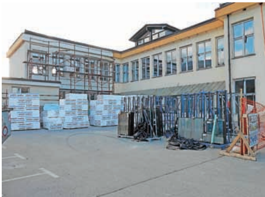
Šola je dobila toplo izolacijo ...

V prvih mesecih novega šolskega leta smo uslužbenci in učenci Osnovne šole Davorina Jenka Cerklje na Gorenjskem zelo veseli izolacije, ki nas obdaja, ter novih oken, ki mrazu ne dovolijo več, da bi vstopal v šolske prostore.