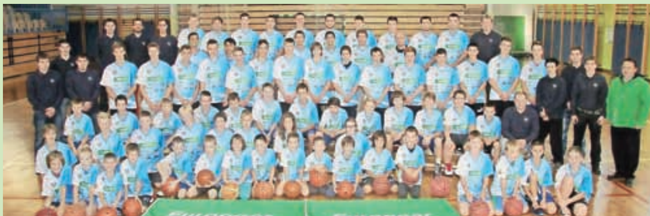
Košarkarji Športnega društva Krvavec