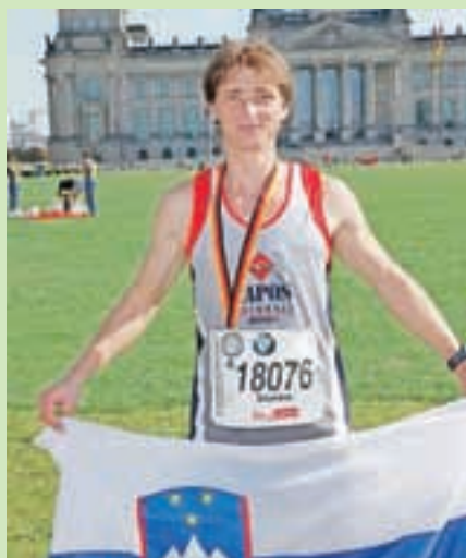
Predsednik Športnega društva Adergas je tudi navdušen in zelo uspešen maratonec.

Športni objekti danes sicer niso več v najboljšem stanju (imajo še igrišča za nogomet in